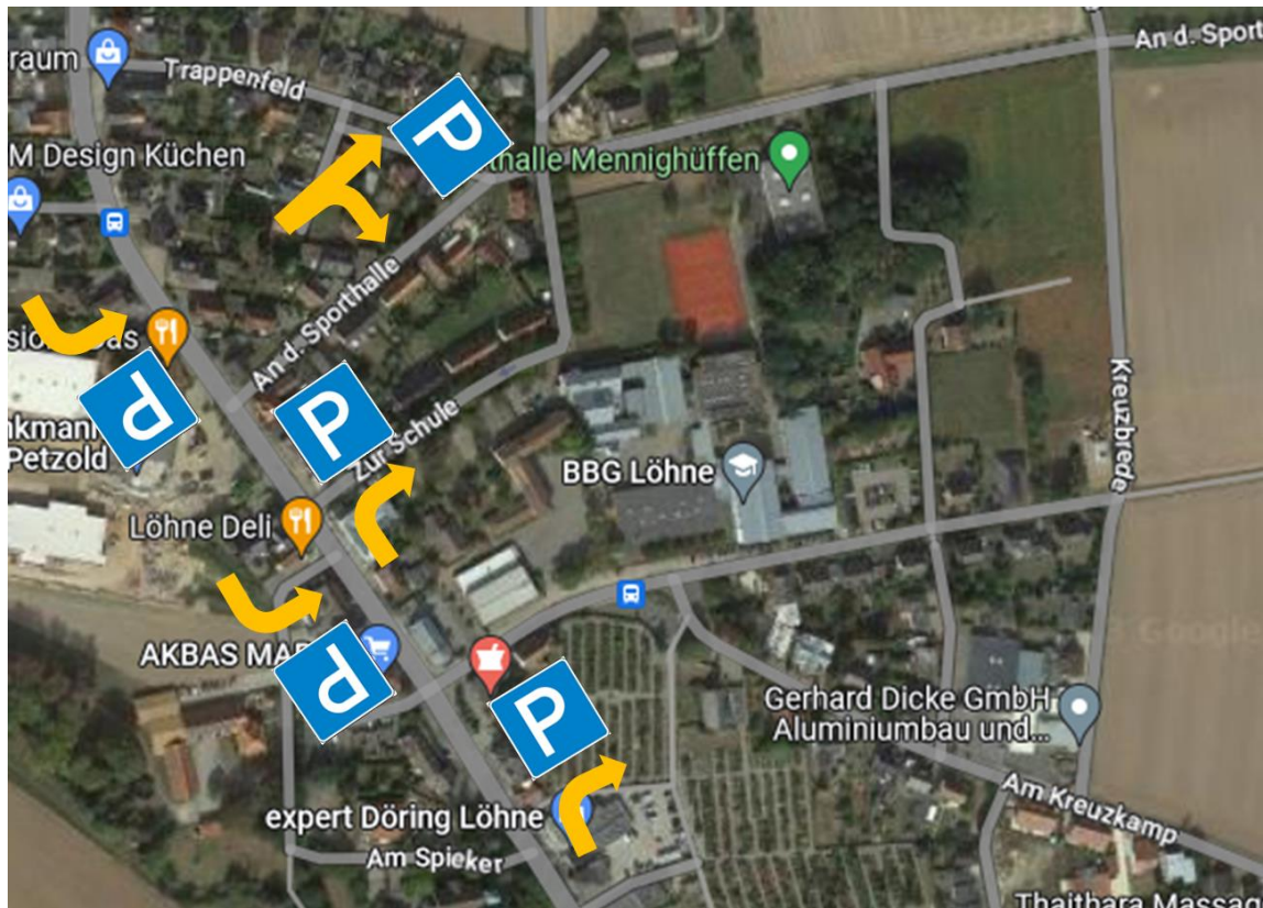
Abbildung 02: Beschilderung ab der Lübbecke Straße zu den vorhandenen ca. 120 Parkplätzen im Bereich der Grundschule/Gesamtschule => zu Punkt 4)