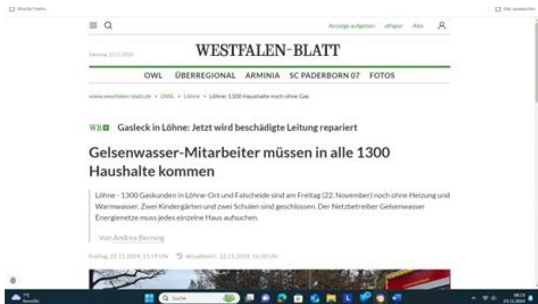
Abbildung 04: Gasleck in Löhne: Jetzt wird beschädigte Leitung repariert