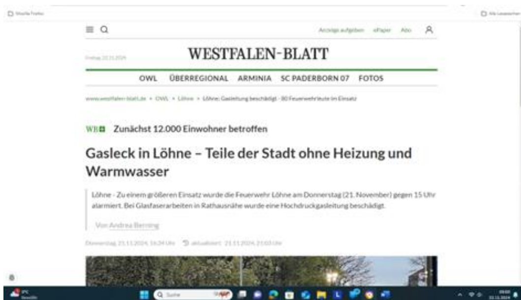
Abbildung 02: Gasleck in Löhne – Teile der Stadt ohne Heizung und Warmwasser