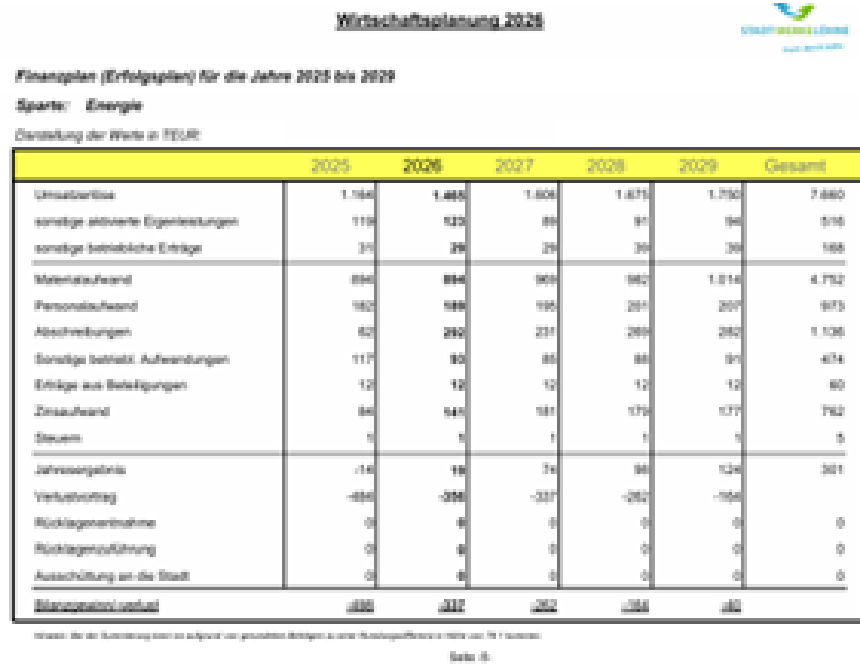
Abbildung 03: Erfolgsplanung der Jahre bis 2029