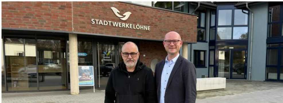
Abbildung 01: Presseartikel des Westfalen-Blatts vom 15. Dezember 2025