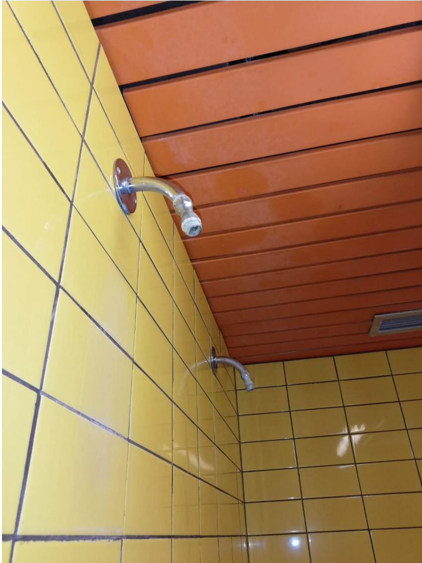
Abbildung 05: verdreckte Duschen