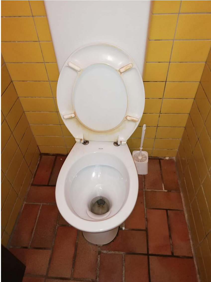
Abbildung 02: Beispielhafter Zustand einer Toilette in der Sporthalle Mennighüffen (weitere Fotos dieser Art können nachgereicht werden)