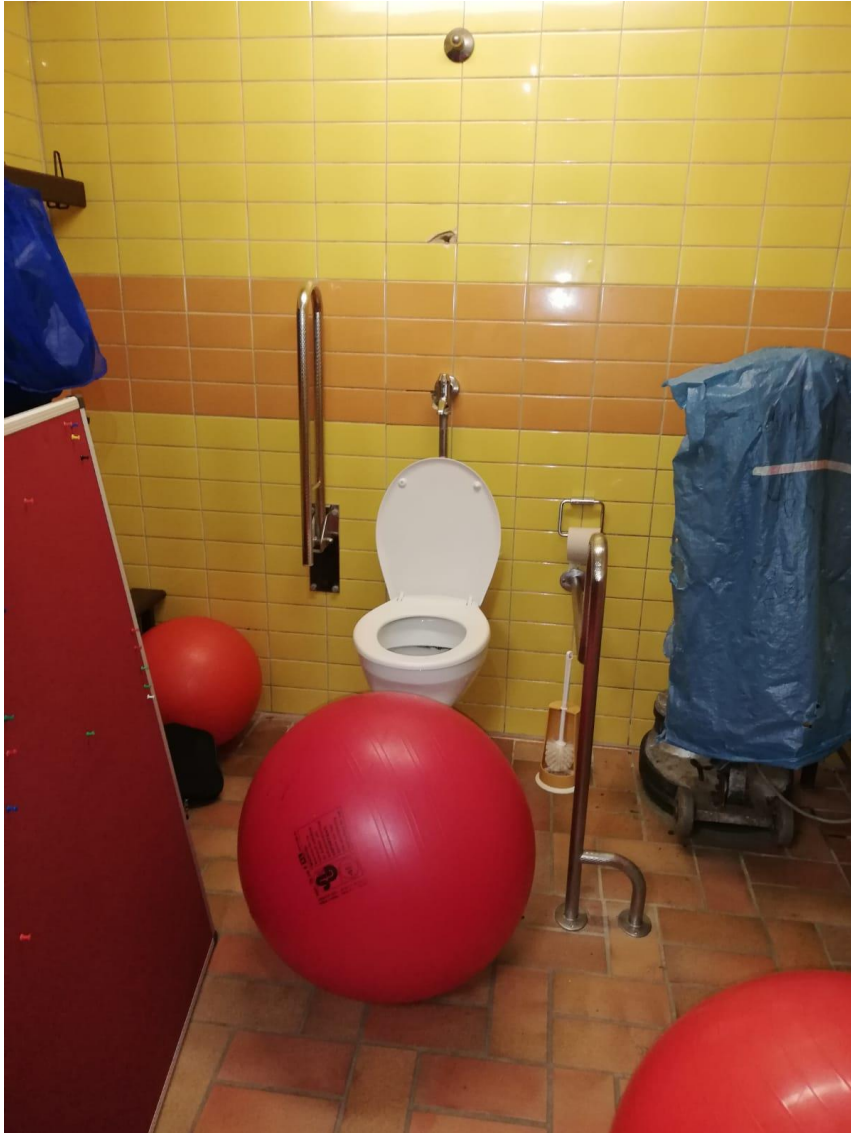
Abbildung 03: gleichzeitige Behindertentoilette und Aufbewahrungsraum