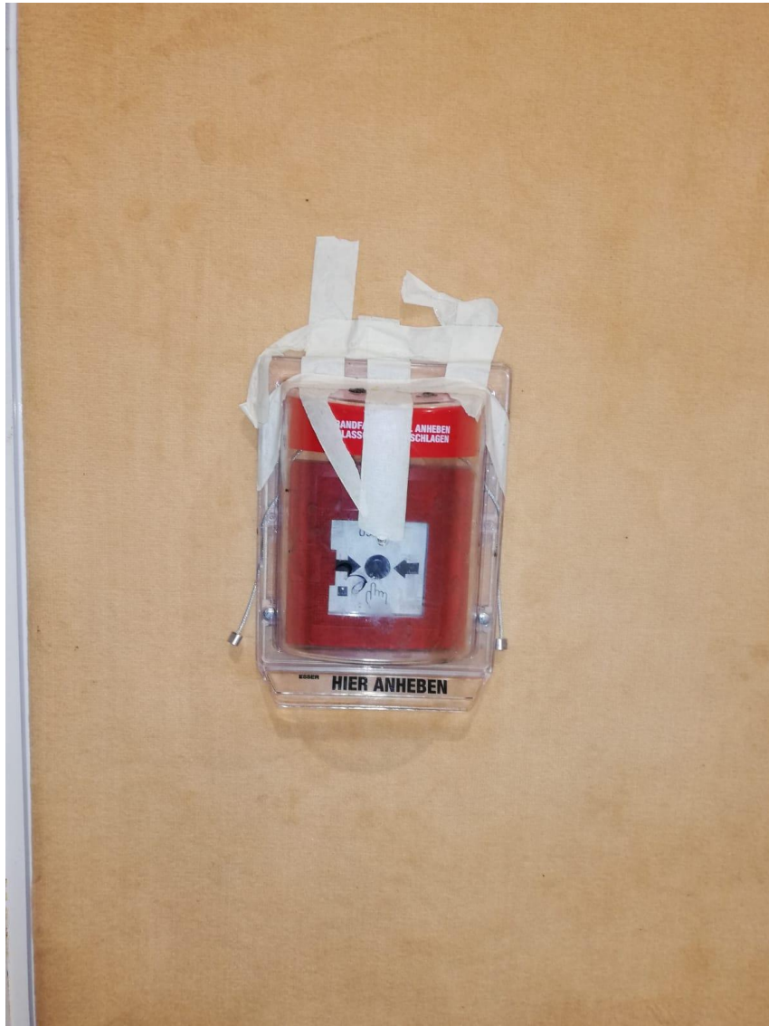
Abbildung 01: Feuermelder - ohne Kommentar -