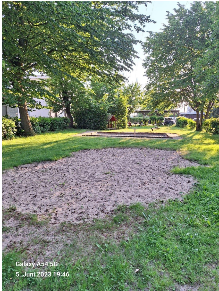
Abbildung 02: Sandfläche / abgebaute Spielgeräte auf dem Spielplatz „Auf der Riege“, Men- nighüffen