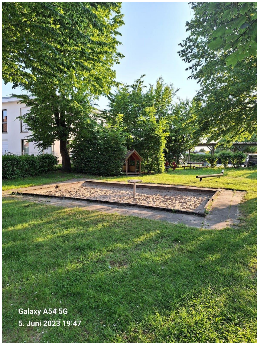
Abbildung 03: Sandkasten / abgebaute Spielgeräte auf dem Spielplatz „Auf der Riege“, Mennighüffen