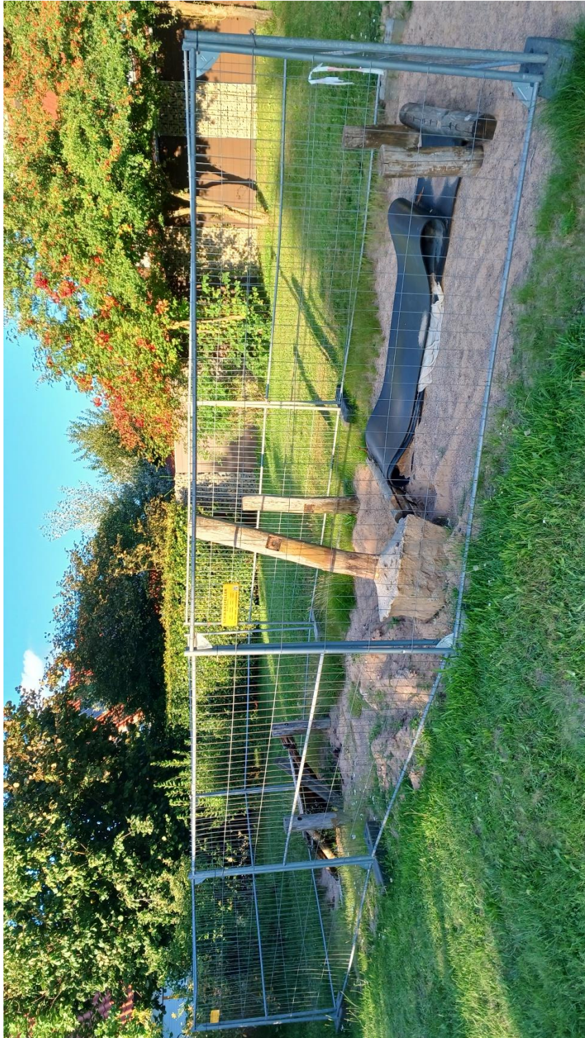
Abbildung 02: verlassene Baustelle mit halb abgebautem Wippenband